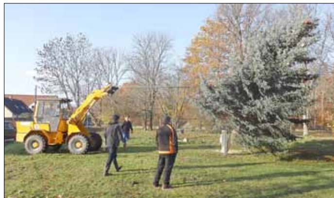
Einen Radlader braucht es beim Aufstellen schon.

Allen Breitenfeldern, Freunden und Nachbarn wünscht der Verein eine friedliche und besinnliche Adventszeit und ein frohes Weihnachtsfest.