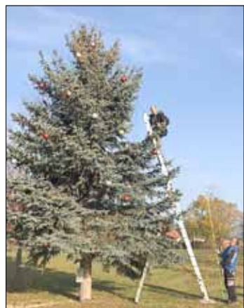
Schmücken des Baumes