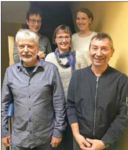
Der neue Vorstand

Die neue personelle Zusammensetzung des Vorstands bündelt Erfahrung aus vielen Jahren Bürgervereinsarbeit und neue Ideen mit dem Ziel, Breitenfeld als lebens- und liebenswerten Ort mit einem gesunden Miteinander zu gestalten. In der Wahl vorangegangenen Rechenschaftsbericht wurde deutlich, wie viel allein in den letzten zwei Jahren erreicht worden ist. Gemeinsame Feste, Arbeitseinsätze und die Erneuerung und Erweiterung des Spielplatzes sind nur einige Beispiele. Dahinter steht unermüdliches Engagement vieler Breitenfelder, die aktive Gemeinschaft leben, sich der traditionsreichen Geschichte des Ortes bewusst sind und diese weiter-schreiben möchten.